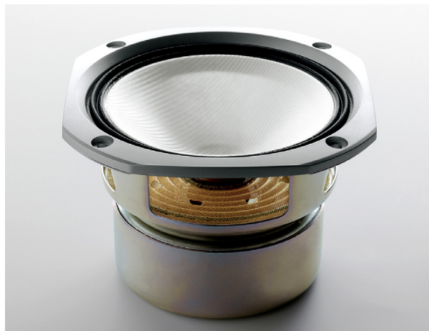
X-N7EX ウーファーユニット部

さらに振動板を駆動する磁気回路には、コンパクトオーディオではあまり例を見ない8cm径の大型マグネットを採用しています。クラスを超える強力な磁気回路で理想的な振動板を力強く駆動することにより、低音楽器の余韻は引き立ち、音の輪郭はくっきりと映し出されて、音場の広がりや豊かに感じ取っていただけることでしょう。